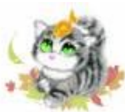
ビビ 好きな俳優 ジョニー・デップ