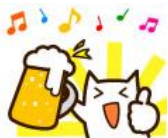
ブッチ しっかりもの