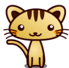
りっこ 最年長 めんたいこ大好き