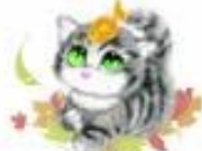
ビビ 気分屋 ゲームおた